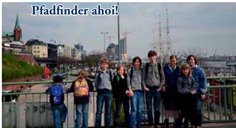
Ein Teil des Stammes während der Rallye durch den Hafen

12. August ab 18 Uhr. Mitzubringen sind vor allem gute Laune. Für eine bessere Planung melden Sie sich bitte bis zum Freitag, 5.8. im Kirchenbüro (persönlich, telefonisch, über Anrufbeantworter, Zettel in den Briefkasten oder per E-Mail: broder.hinrick@t-online.de )